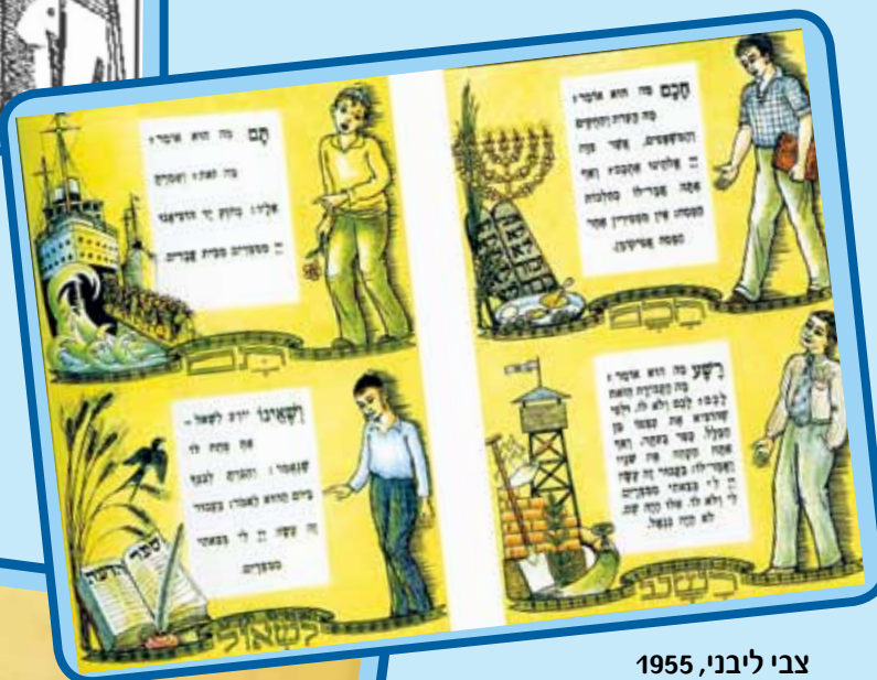
צבי ליבני, 1955