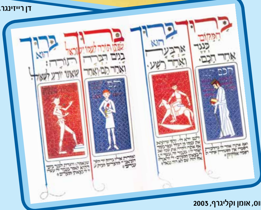
דוד מוס, אומן וקליגרף, 2003

שאלות לדיון ומחשבה: הרב ישראל סלנטר אמר: "כל יחיד כולל בתוכו את כל ארבעת הבנים שבהגדה" (ליטא, המאה ה-19). כיצד "משוחחים" דבריו עם היצירה?