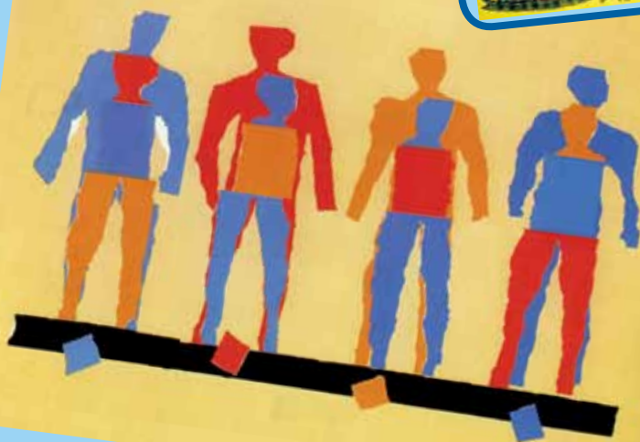
דן רייזינגר, 1982

שאלות לדיון ומחשבה: הרב ישראל סלנטר אמר: "כל יחיד כולל בתוכו את כל ארבעת הבנים שבהגדה" (ליטא, המאה ה-19). כיצד "משוחחים" דבריו עם היצירה?