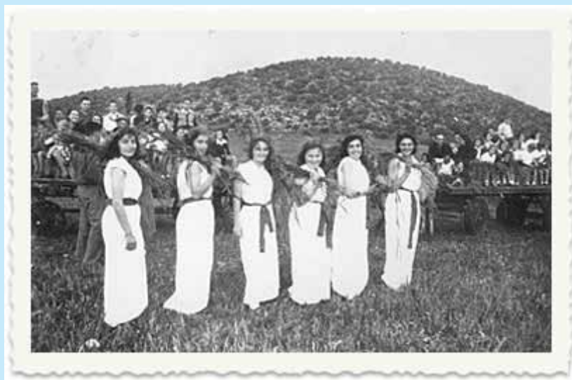
בנות נוער, קיבוץ שער העמקים, שבועות 1944, מתוך אתר החגים מכון שיטים